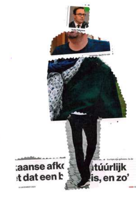
Gemaakt door Dirk