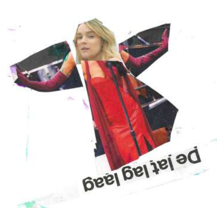
Gemaakt door Amin